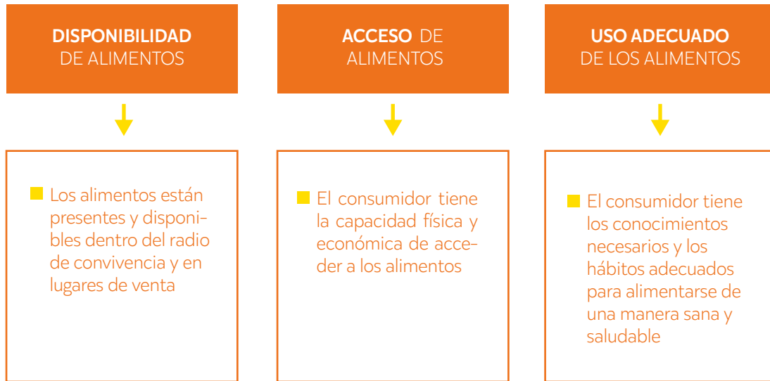
IMAGEN 3: PILARES DE LA SEGURIDAD ALIMENTARIA

Elaborado por: Fundación Alternativas (2020)